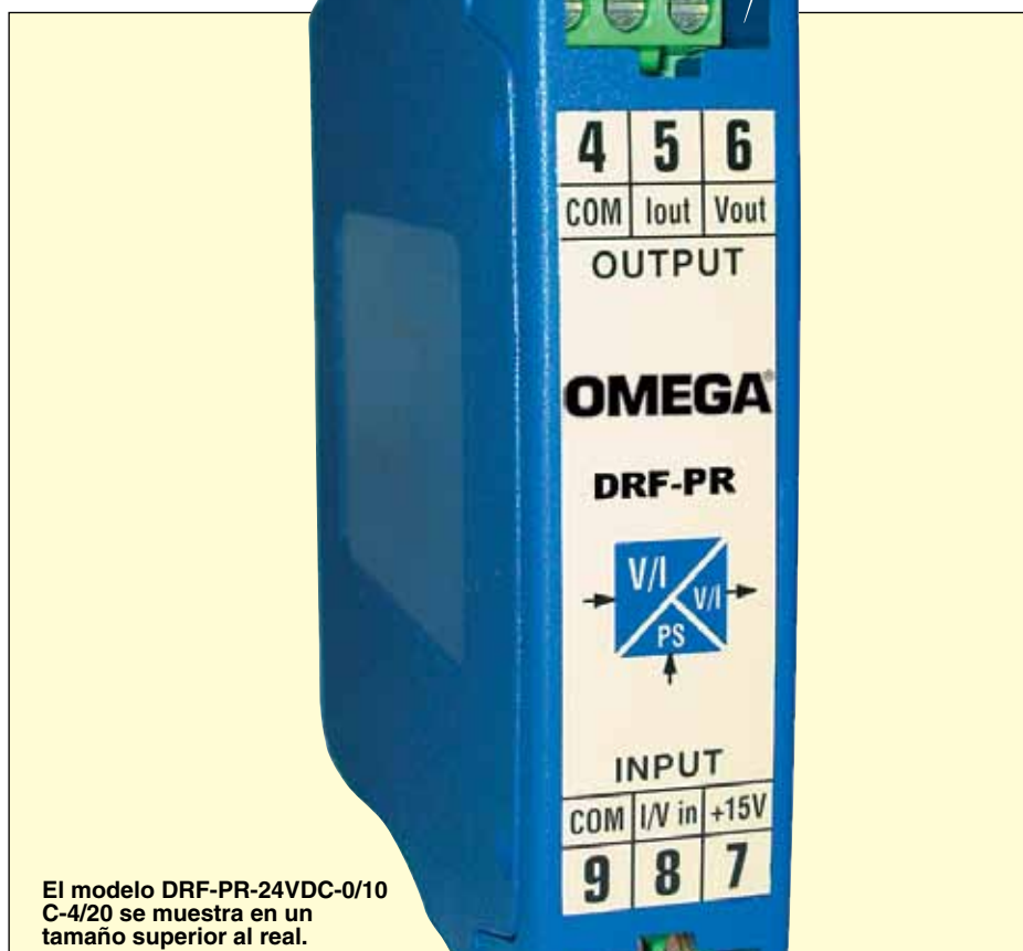
El modelo DRF-PR-24VDC-0/10 C-4/20 se muestra en un tamaño superior al real.

Salida Vexc. para transductores: +15 Vcc ±10% (máx. 22 mA)