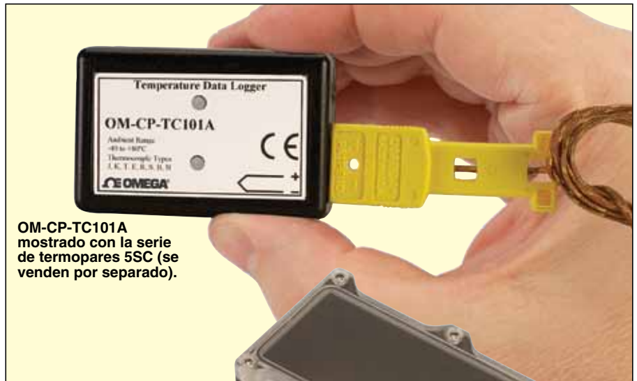
OM-CP-TC101A mostrado con la serie de termopares 5SC (se venden por separado).

† Para obtener información sobre pedidos de calibración NIST, consulte la tabla de pedidos de la página.