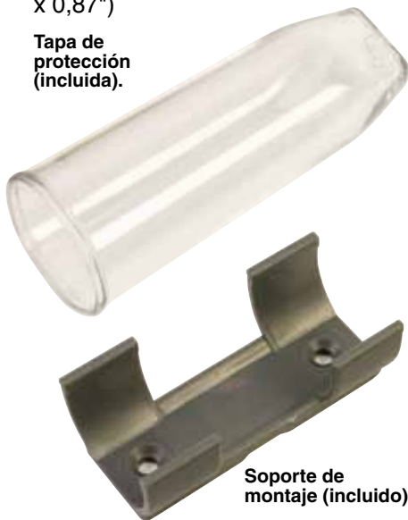
Soporte de montaje (incluido).