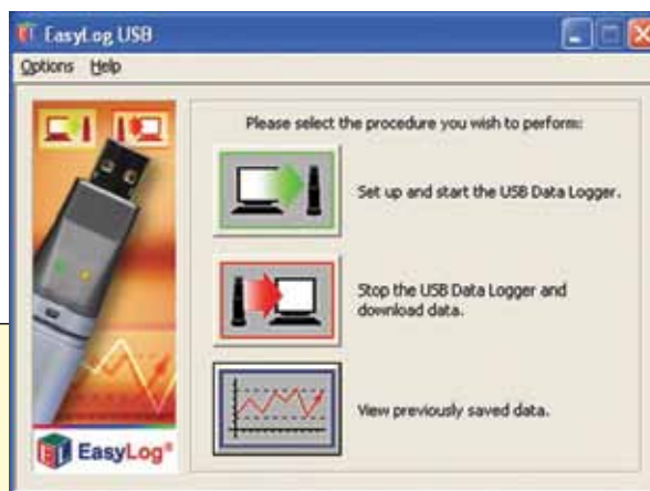
Pantalla de configuración del software para Windows.