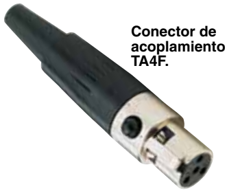
Conector de acoplamiento TA4F.

UWRD-2 se muestra más pequeño que el tamaño real.