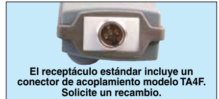
El receptáculo estándar incluye un conector de acoplamiento modelo TA4F. Solicite un recambio.

Los datos recibidos por el UWTC-REC pueden recibirse y mostrarse en su ordenador con ayuda del software central para termopar que se incluye con cada unidad. El software central para termopar puede convertir su ordenador en un registrador de banda o de datos, de modo que las lecturas quedan almacenadas y se pueden imprimir o exportar a una hoja de cálculo.