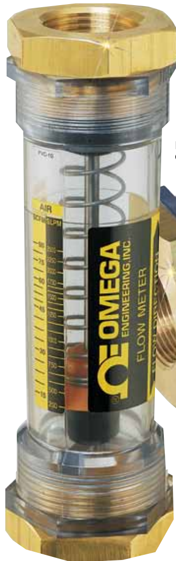
El modelo FL-510 se muestra en un tamaño inferior al real.