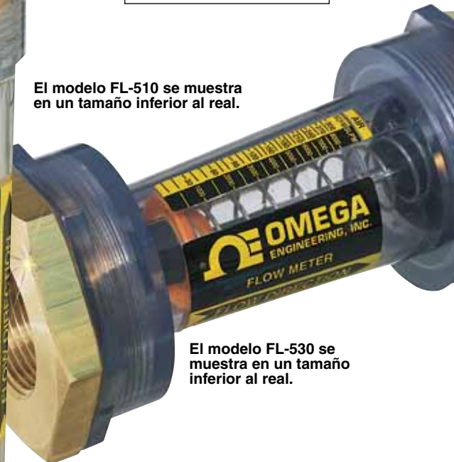
El modelo FL-530 se muestra en un tamaño inferior al real.