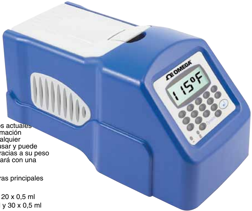
El modelo TCY25 se muestra en un tamaño inferior al real.