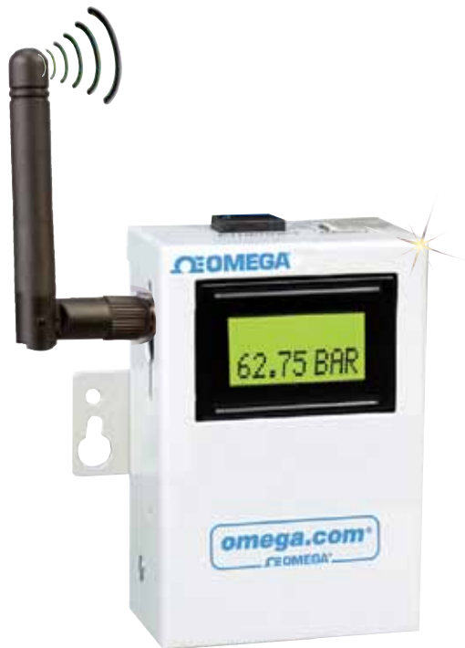
UWTC-REC2-D, receptor inalámbrico de 48 canales con salida y pantalla analógica.

La configuración del DPG proporciona una práctica conexión USB con su dispositivo. Por favor, consulte el manual para más detalles sobre la instalación del mismo.