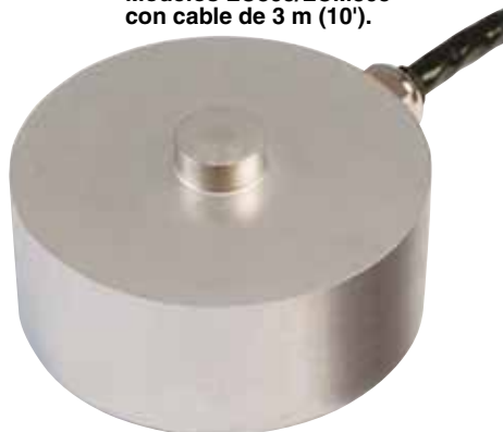
El modelo LCM305-2KN se muestra en su tamaño real.