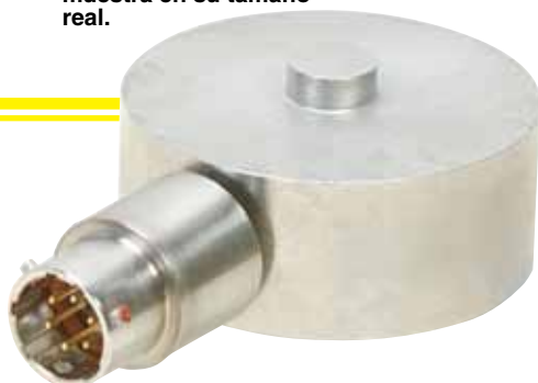
Modelos LC315/LCM315 con conector con cierre giratorio.

El modelo LC315-500 se muestra en su tamaño real.