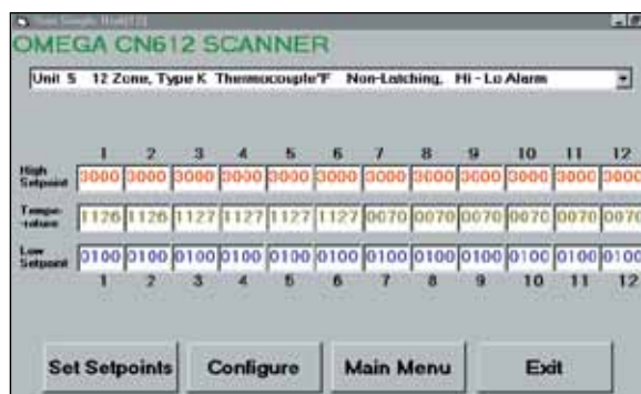
Pantalla de configuración del software