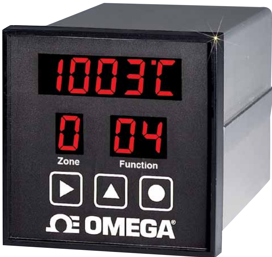
El CN616TC1 se muestra en su tamaño real.

La serie CN616 es un regulador basado en microprocesador de 6 bucles altamente versátil diseñado para una operación y configuración remota o en panel frontal fáciles. Cada una de las 6 zonas se escanea secuencialmente y se muestran las zonas activas. Las zonas individuales pueden bloquearse para la monitorización. Cada instrumento se programa para satisfacer las necesidades del operador para: tipo de termopar, unidades de temperatura; alarma alta, baja o alta/baja configurada como con o sin enclavamiento; y ajuste automático con recorte manual o configuración PID manual. El operador puede configurar el tiempo de escaneo de pantalla de la zona y la rampa/espera. Los parámetros y los puntos de referencia se guardan cuando los dispositivos están apagados. La protección con contraseña se proporciona para evitar cambios accidentales a la calibración, el ajuste de PID y el perfil de rampa/espera. Si se